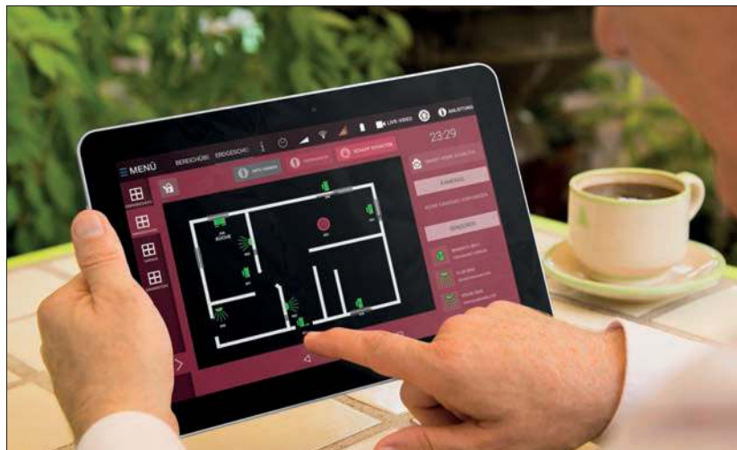
SmartHomeTab kann auch von Senioren und unerfahrenen Nutzern bedient werden.

Mit Hilfe dieser Punkte haben wir einige der führenden Smart-Home-Basistechnologien sowie einen Newcomer in diesem Markt verglichen, um herauszufinden, welches System die besten Voraussetzungen für das Smart Home der Zukunft mitbringt.