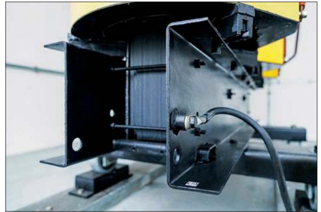
Vorher – Nachher

wendig helfen unsere Mitarbeiter manuell oder mit einem Industriegebläse nach. Es ist wichtig, den Transformator von allen wässrigen Reinigungsmittelresten zu befreien, bevor er wieder unter Spannung geschaltet wird.« Vor Wiederinbetriebnahme wird eine abschließende Funktionsprüfung durchgeführt und alle Verbindungsschrauben auf ihre Festigkeit kontrolliert.